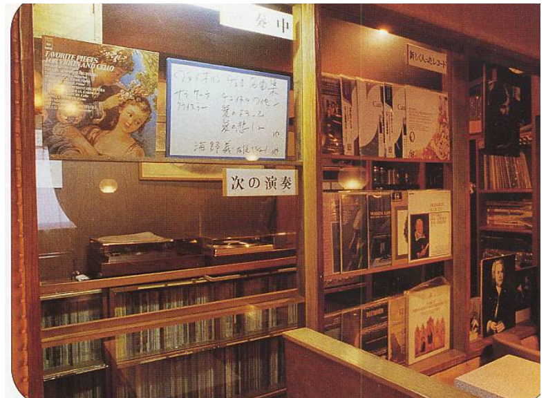
ホワイトボードに演奏中の曲とアーティスト名が紹介されています。

ここはなにかとこだわりがある店で、真空管アンプを使い、スピーカーはタンノイとヴァイボックスの2種類を使い分け、だす水は海水を真水に変えるほどの浄水器で作り、コーヒーカップは「ウェッジウッド」製でした。いままで喫茶店で「ウェッジウッド」を使っているのを見たのはここだけです。なぜ「ウェッジウッド」を使っているかというと、国産